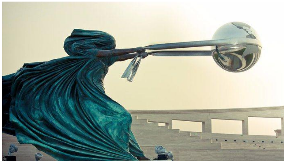
Mère Nature , photo et œuvre du sculpteur italien Lorenzo Quinn www.lorenzoquinn.com

Alerte Pétrole Rive-sud 3 septembre 2015